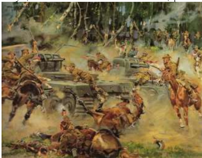
«Битва под Кутно в 1939 г.». К. Ежи

Германская армия существенно превосходила польскую и по численности, и по техническому оснащению: по самолётам — примерно в пять раз, по танкам — в 3,5 раза. Огромное техническое преимущество позволило обеспечить блицкриг — молниеносный разгром противника.